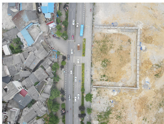
项目建设区航拍图