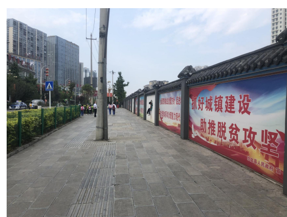
项目建设区外侧道路