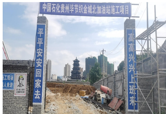
项目施工临时出入口