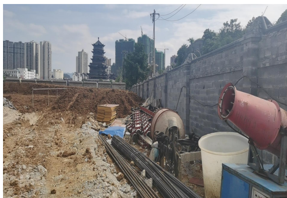
主体工程前期剥离表土